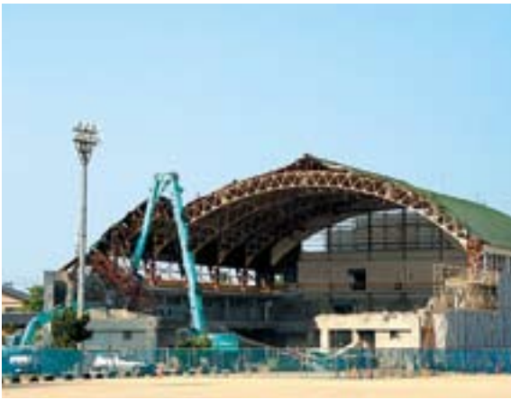
小千谷小学校改築のため市民体育館取り壊し