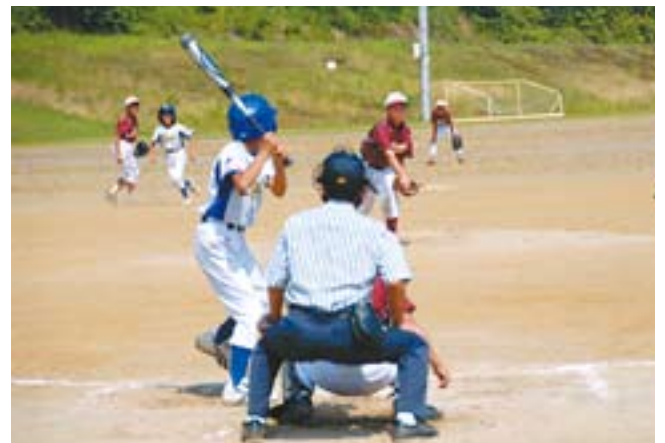
スポーツ交流少年野球大会で子どもたちが交流