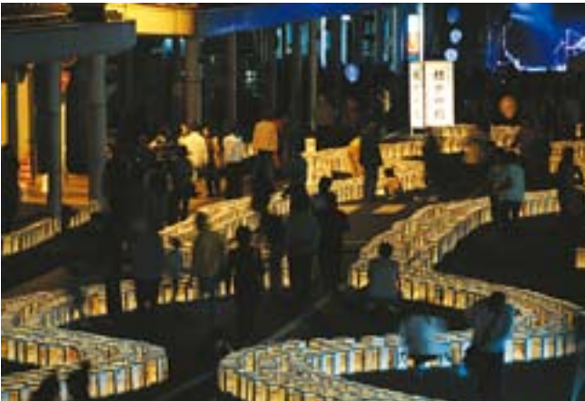
青年会議所が震災復興イベント「結びの灯」開催