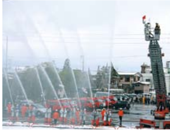
消防出初式で一斉に放水