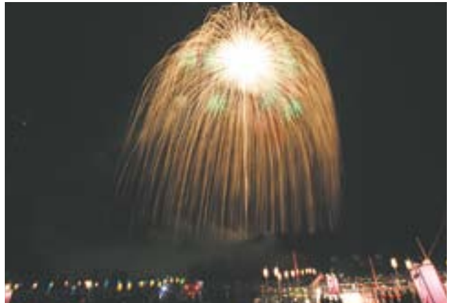
美しい花火が夜空を彩った片貝まつり花火大会