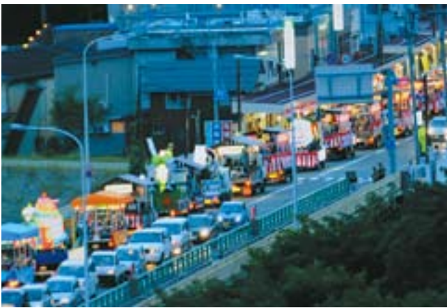
おぢやまつりでの万灯パレード