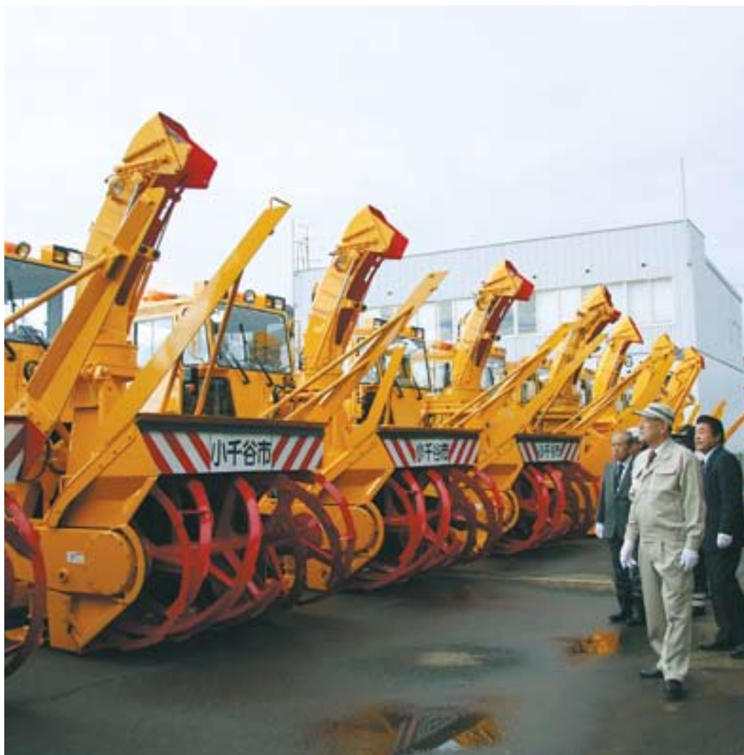
～並んだ除雪車両が一斉に試運転～ 12月1日(月)、小千谷市車両センターで行われた除雪隊の結成式

雪国小千谷に住む私たちの生活は、雪とは切っても切れないもので、昔からみんなで協力して雪を克服してきた歴史があります。除雪のルールやマナーを守り、「地域ぐるみ」で効率的な除雪作業に取り組みましょう。