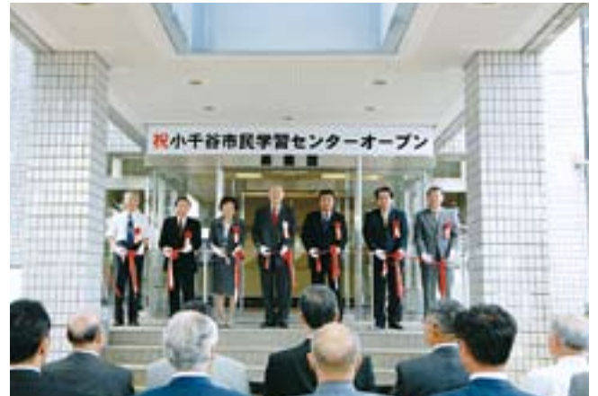
市民学習センター「楽集館」開館