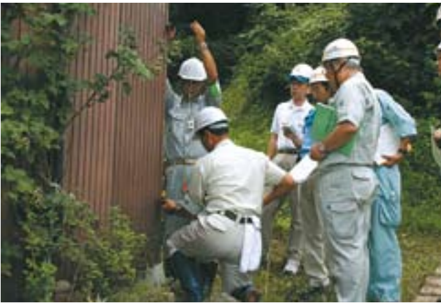
中越大震災ネットワークおぢや研修会を開催