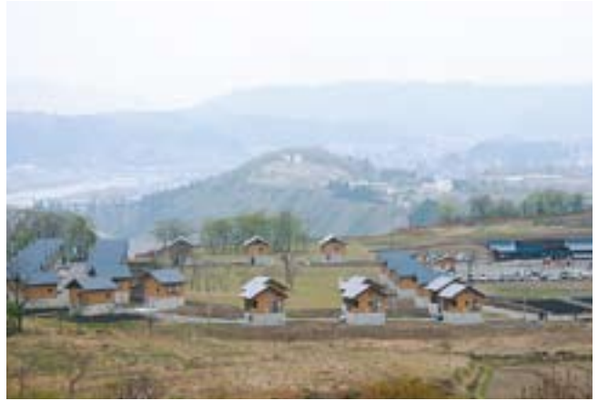
ラウベ全30棟が完成したふれあいの里