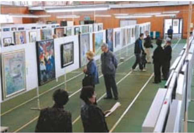
東小千谷体育センターで開催された市展