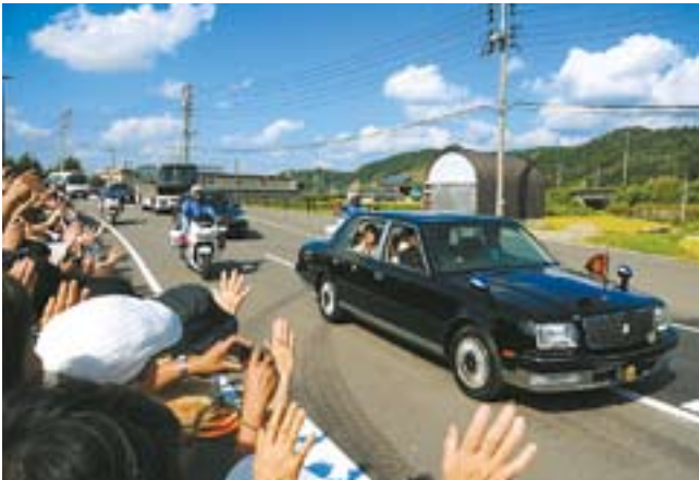
天皇后両陛下をおおぜいのみなさんが歓迎