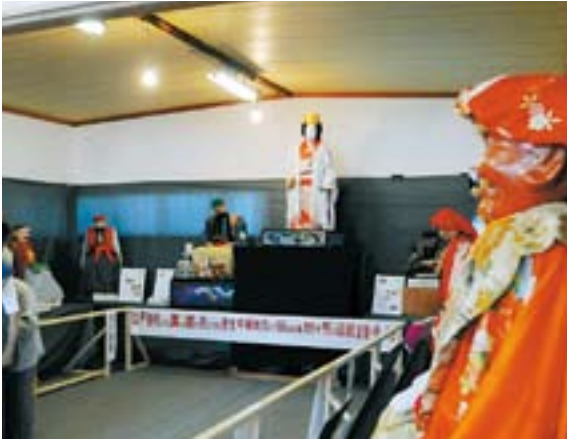
巫女爺人形操りが県無形民俗文化財に指定

2008年も残すところわずかになりました。みなさんにとって今年 はどんな年だったでしょうか。小千谷のこの1年のできごとを振り返ってみました。