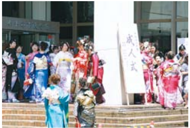
華やかさがただよう成人式