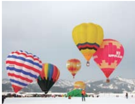
天候に恵まれなかったおぢや風船一揆