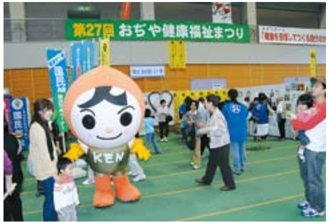
おおぜいの来場者でにぎわった健康福祉まつり