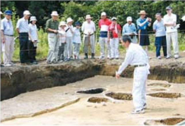
元中子遺跡発掘現場で現地説明会開催