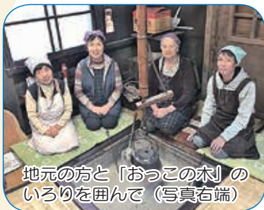
地元の方と「おっこの木」のいろりを囲んで（写真右端）

冬は雪深く、春になると緑に覆われ、静かな時を過ごせるところです。訪れる人に、新潟、小千谷、若柘の魅力を伝え、二度、三度と訪れたくなるように、また、地域に笑顔があふれるように、これからもがんばります。