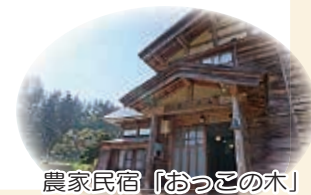
農家民宿「おっこの木」